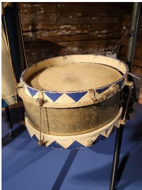
3. Trommel (DG Musik)