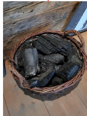
4. Kohlekorb (OG Holz/(Kohle))