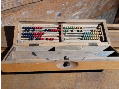
1. Rechenschieber (DG Soziales)

Findest du die Objekte im Museum wieder? Was sind das für Gegenstände?