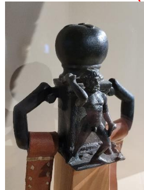
8. Wagenaufsatz aus Bronze (OG Flur)