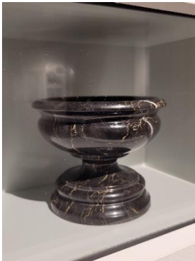
7. Schale aus Marmor (OG Marmor II)