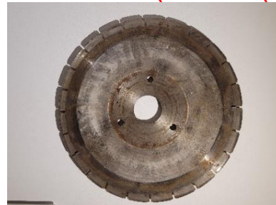
6. Trennscheibe (OG Marmor I)